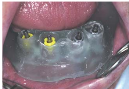
Abb. 1: Pickup-Technik – Fixierung der Implantat-Abformpfosten mittels Halteschrauben. – Abb. 2: Pickup-Technik – „kaminartige“ Gestaltung des individuellen Abformlöffels.