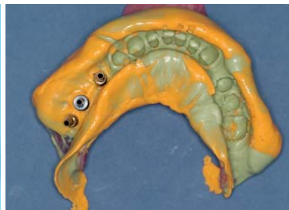
Abb. 3: Pickup-Technik – einphasige Implantatabformung. – Abb. 4: Pickup-Technik – zweiphasige Implantatabformung.