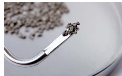
Tigran™ poröses Titangranulat

• Sicher. Titan ist ein geprüftes, anorganisches Material in der Zahnmedizin, das keinerlei Risiken der Kontamination birgt