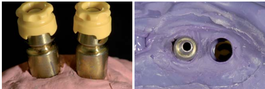
Abb. 8: Abformpfosten mit aufgesteckten Transfer-Caps. – Abb. 9: Reponierung der Abformpfosten in die in der Abformung verbliebenen Transfer-Caps.

Die damit verbundene Notwendigkeit, die gesamte Stumpfoberfläche einschließlich der „Präparationsgrenze“ bzw. der Oberkante des Implantates exakt darzustellen, erschwert das Abformprozedere erheblich. Diese Situation erfordert eine Abformtechnik, die der Abformung natürlich präparierter Zähne entspricht (Korrektur- bzw. Doppelmischabformung). Naturgemäß ergeben sich hierbei die gleichen Schwierigkeiten (Notwendigkeit des Fadenlegens, Blutungen bei der Abformung etc.) und Limitationen in der Passgenauigkeit des Zahnersatzes, so wie sie auch von herkömmlichen Abformungen bekannt sind. Aus diesen Gründen ist von