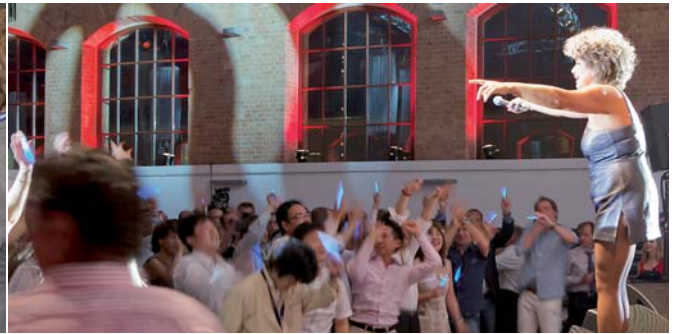
Tina Turner rockte die Party.