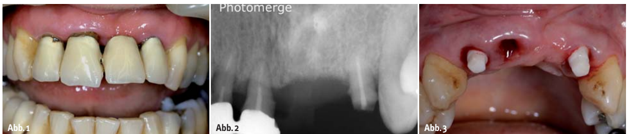
Abb. 1: Fraktur der Frontzahnbrücke. – Abb. 2: Zähne 12, 11 und 22 waren nicht erhaltungsfähig. – Abb. 3: Sofortimplantation mit zwei zit-z Implantaten, Fa. ziterion, Uffenheim.

Implantate sind in den letzten 40 Jahren zu einem ausgereiften Therapieverfahren in der zahnärztlichen Behandlung geworden. Hohe Erfolgsraten haben die Indikationen vom zahnlosen Kiefer ausgeweitet auf jegliche orale Rehabilitation nach Zahnverlust. Etabliert hat sich dabei der Werkstoff Reintitan, der sich neben einer gut dokumentierten biologischen Verträglichkeit auch aufgrund seiner physikalischen Eigenschaften bewährt hat. Zahlreiche Studien haben sowohl mit großen Fallzahlen und langen Beobachtungszeiträumen die Eignung von Titanimplantaten hinreichend belegt. Dennoch werden auch Nachteile über Werkstoff Titan für enossale Implantate diskutiert. Ein Problem stellt die dunkle Farbe und die fehlende Transluzenz des Titans im ästhetischen Bereich dar. Bei dünn ausgeprägter Schleimhaut kann es zu einem störenden Durchschimmern des grauen Metalls kom-