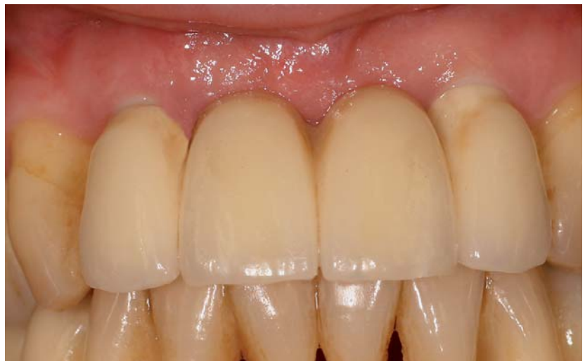
Abb. 6: Prothetische Versorgung mit einer vollkeramischen Brücke.

Für den Ablauf der Osseointegration werden drei aufeinanderfolgende Stufen angegeben. Erstens die osteokonduktive Phase, bei der sich knochenbildende Zellen differenzieren und auf der Implantatoberfläche anlagern. Zweitens die Phase der Knochenneubildung und die dritte Phase des Knochenumbaus zu ausgereiften Knochen. Für die unterschiedliche Geschwindigkeit und Qualität dieser biologischen Prozesse werden die Implantatwerkstoffe und die Implantatoberfläche verantwortlich gemacht. Zirkonoxidkeramik hat sich in Untersuchungen sowohl als biokompatibel als auch als nicht abbaubar im Organismus bewiesen. Beide Eigenschaften sind Voraussetzung für den Einsatz als Werkstoff für dentale Implantate. Bei den vorgefundenen tierexperimentellen Untersuchungen